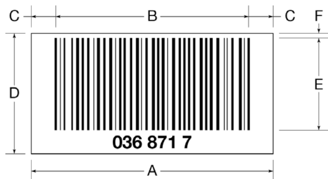
Фигура 2 Размери на баркода