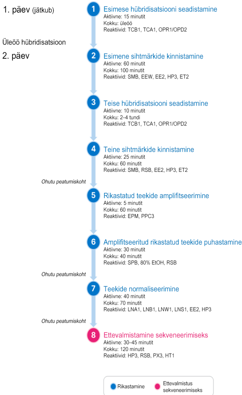
joonis 2 TSO Comprehensive (EU) Töövoog (2. osa)

joonis 2 on kujutatud TSO Comprehensive (EU) rikastamise töövoog. Etappide vahele on märgitud ohutud peatumiskohad.