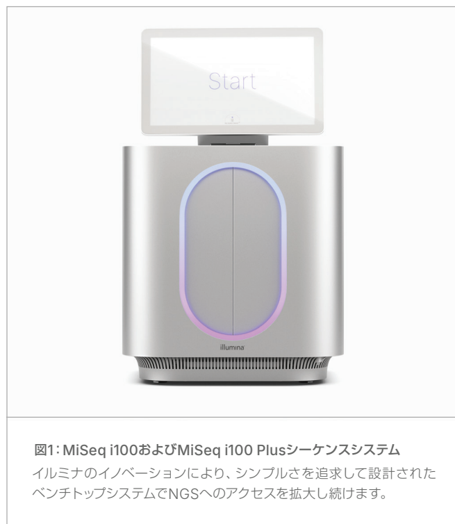
図1: MiSeq i100およびMiSeq i100 Plusシーケンスシステム

イルミナでは、お客様の体験をあらゆるイノベーションの中核に位置付けており、ライブラリー調製、シーケンス、データ解析を可能な限り簡単にすることを目指しています。MiSeq i100シリーズワークフローは、プロジェクトの完了に必要な時間と労力を最小に抑えるためにあらゆる点が最適化されています（表2）。MiSeq i100およびMiSeq i100 Plusシステムは、ランセットアップがわずか3つのステップで20分以内に完了するシンプルなワークフローを提供します。